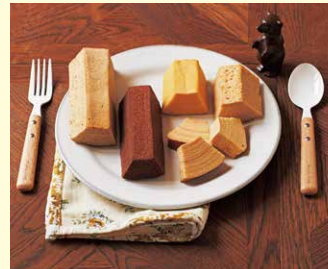
横濱スコーンクラブ

新鮮なたまごを使い、職人が一層ずつ焼き上げた、食べきりサイズのこだわりバウムクーヘン。