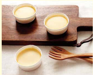
パティスリーサンガ

「ナチュラルな美味しさ」を追求する秋川牧園のたまごと牛乳を使った、濃厚でコクのあるプリンです。