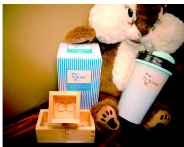
ちょリスタンブラー

JAバンク人気キャラクターである「ちょきんぎょ」と「ちょリス」。当会では毎年、キャンペーンにあわせて「ちょきんぎょ」と「ちょリス」グッズを制作し、多くのお客さまにご好評いただいております。